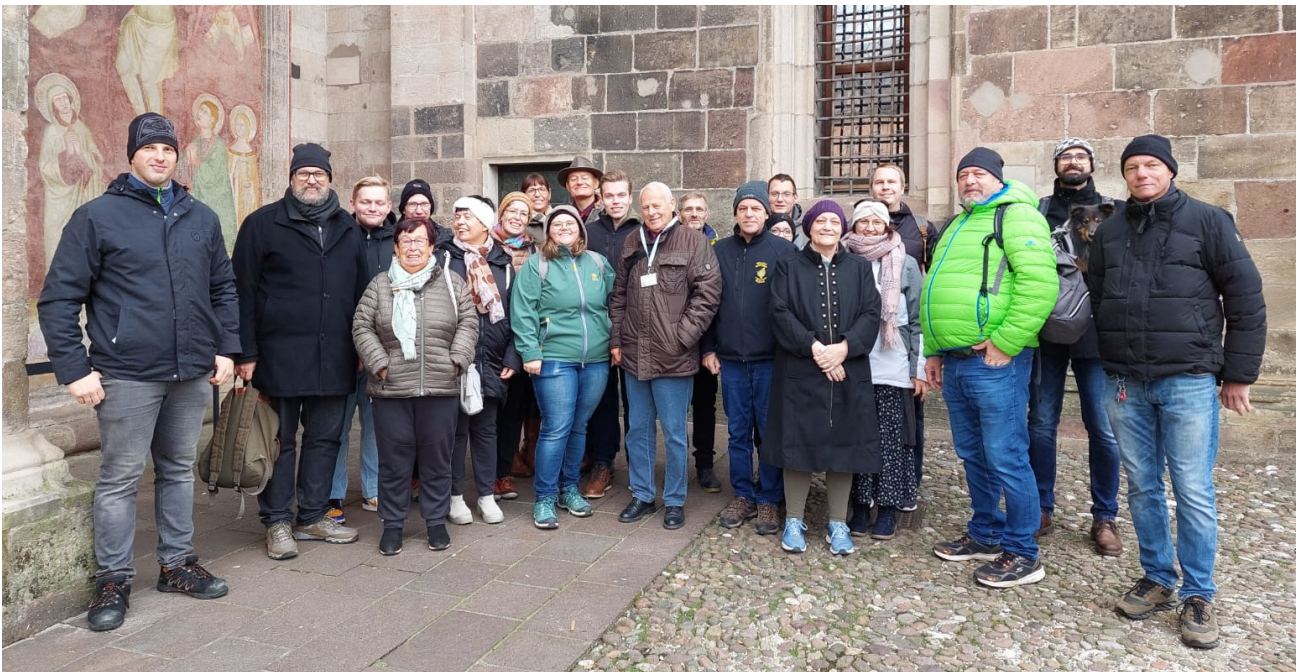
Unser Gruppenfoto vom Vereinsausflug

Ein weiterer Höhepunkt des Jahres war der Vereinsausflug am 12.11. nach Bozen. Gemeinsam fuhren wir mit einem Bus dorthin, um dann an einer Führung durch die Stadt teilzunehmen. Diese beschäftigte sich vor allem mit der Zwischenkriegszeit. Anschließend aßen wir gemeinsam im Batzen Häusel zu Mittag. Danach hatten wir noch ein paar Stunden zur freien Verfügung um die Stadt zu erkunden.