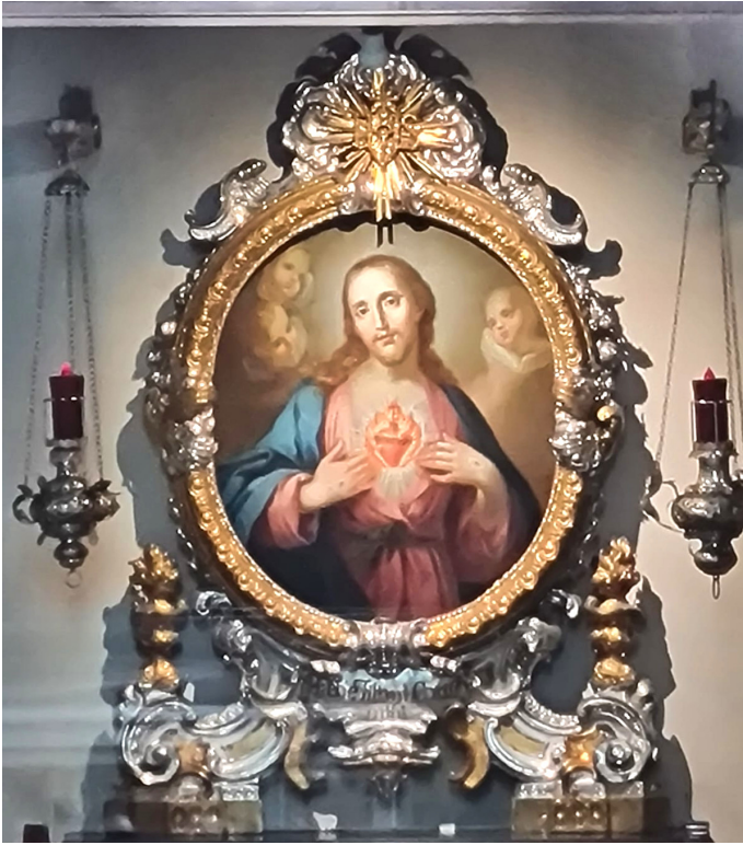
Auch das Herz-Jesu Schwurbild wurde besucht.