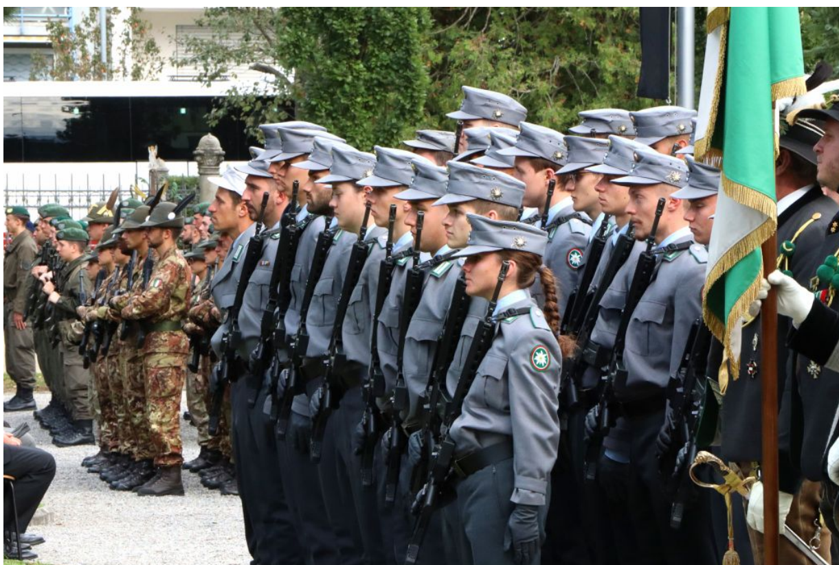
Es waren auch deutsche und italienische Abordnungen anwesend.