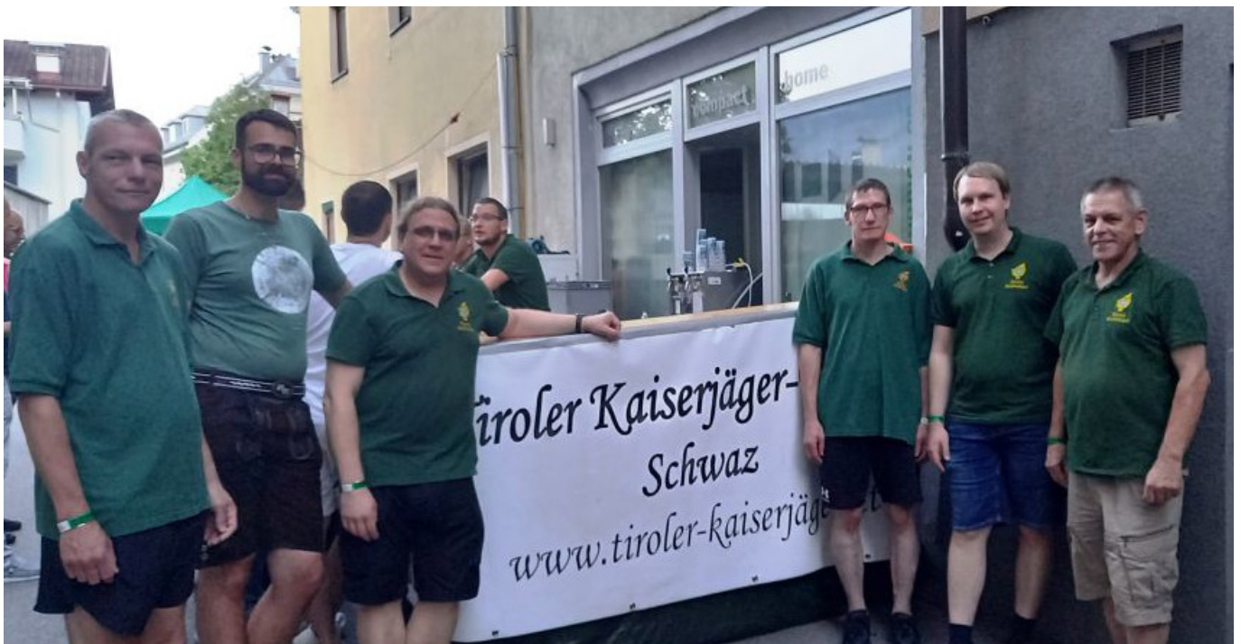
Später kamen noch andere Kameraden zum Schichtwechsel dazu.