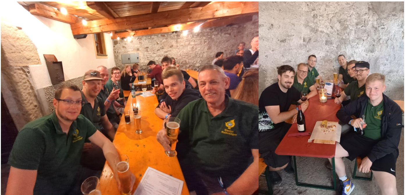
Nicht das letzte Bier beim Mauerfest.

Bereits am 03.06. reisten 10 Schwazer Kaiserjäger nach Auer, um dort das sogenannte Mauerfest zu besuchen. Am Tag darauf fand am Pordoijoch eine Gedenkveranstaltung für verstorbene Soldaten des Ersten Weltkriegs statt.