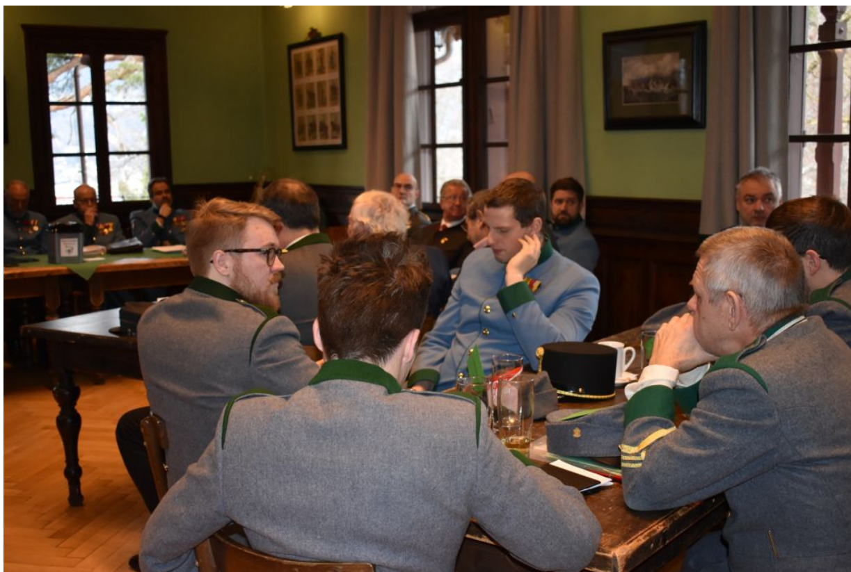
Unser Vorstand berät sich bei der Bundesversammlung

Unser Vorstand und unsere Funktionäre, oder manchmal auch nur der Obmann, nahmen heuer bei der Jahreshauptversammlung der Ortsgruppe Kirchbichl, dem Neujahrsempfang der Silberstadt Schwaz, der Bundesversammlung, einem Empfang der Bürgermeisterin, zwei externen Sitzungen und 2 Ausschusssitzungen teil.