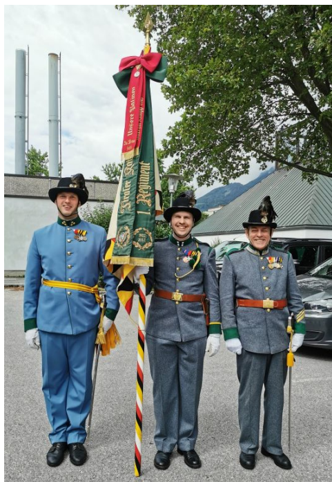
Bei der Primizfeier.