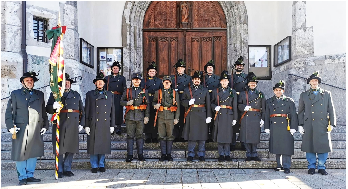
Gruppenfoto am Totensonntag.