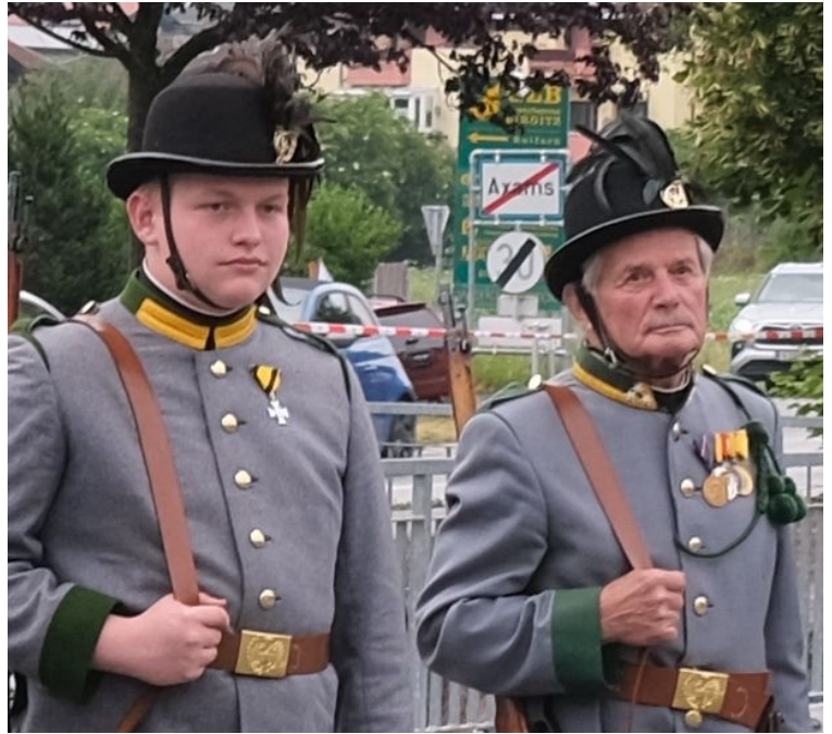
Unser jüngster und unser ältester Aktiver.

Am 30.06. fand in Axams das Schützenfest der Georg-Bucher-Schützenkompanie Axams statt. Dort nahmen auch wir Schwarzer Kaiserjäger als Teil des Ehrenzuges des Tiroler Kaiserjägerbundes am sogenannten Abend der Traditionen teil.