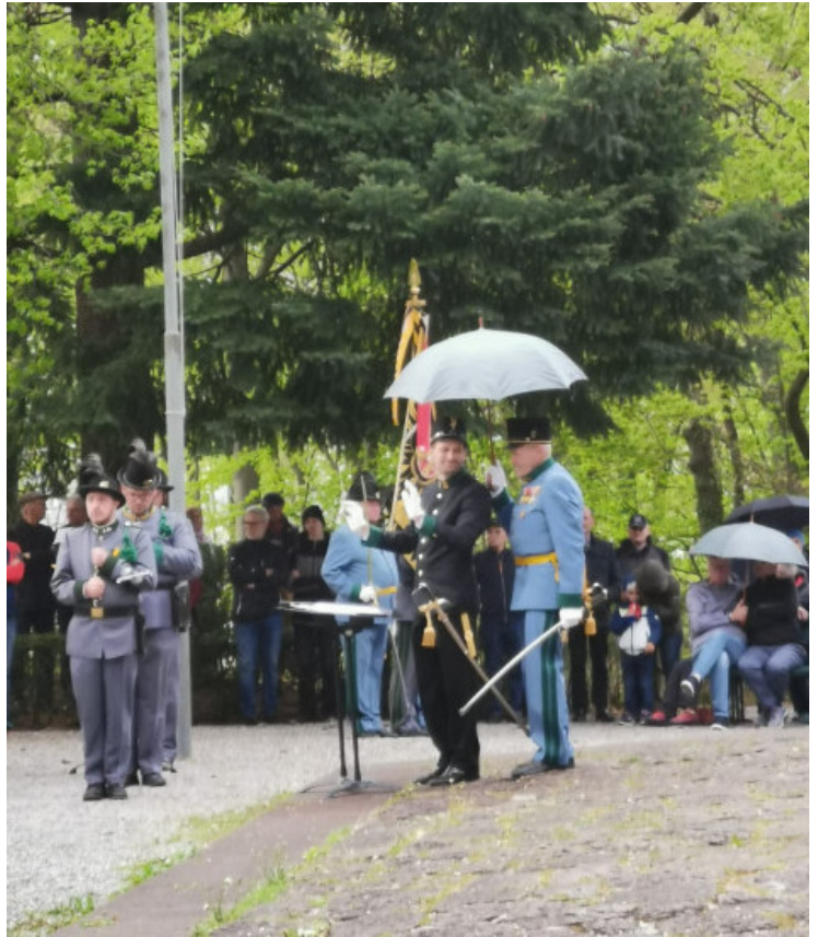
Auch bei Schlechtwetter gibt der Dirigent den Takt an.