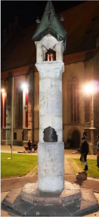
Die rekonstruierte Lichsäule.