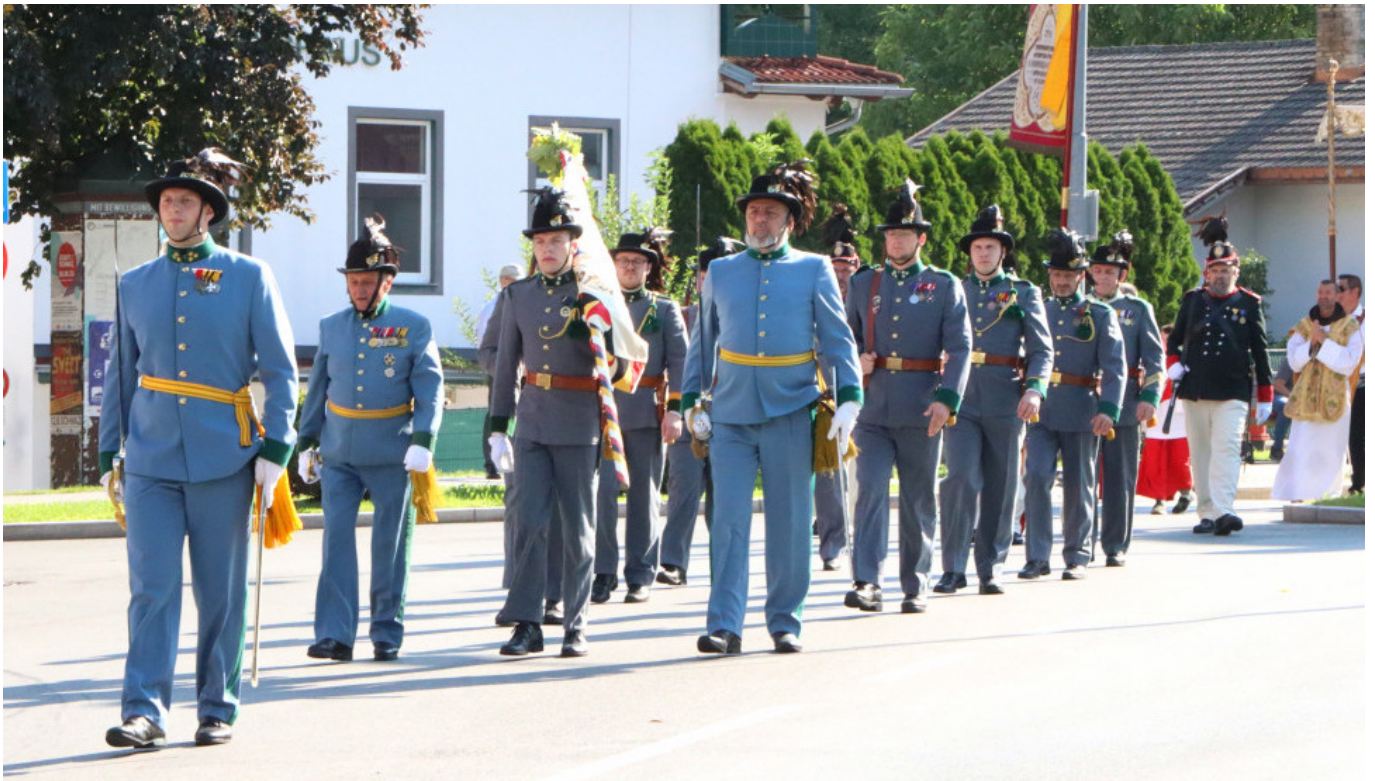
Wir Kaiserjäger marschieren dem Allerheiligsten voran.