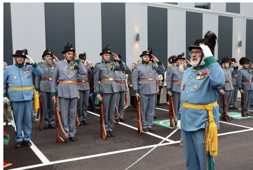
SKKH Karl von Habsburg schreitet die Front ab.