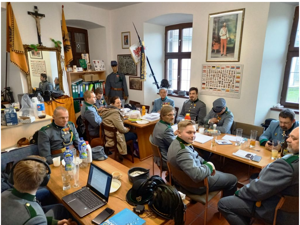
Als Wachlokal diente unser Vereinsheim, das sich auch im Kloster befindet.