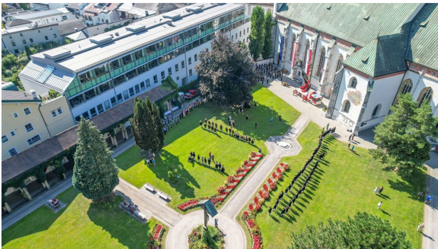
Passend zur Hochzeit, schönster Sonnenschein.

Am 09.09. heiratete unsere Frau Bürgermeisterin Victoria Weber und dazu versammelten sich viele Schwazer Vereine, darunter natürlich auch wir Kaiserjäger, im Stadtpark, um dieses besondere Ereignis mit Ehrensalven zu feiern.