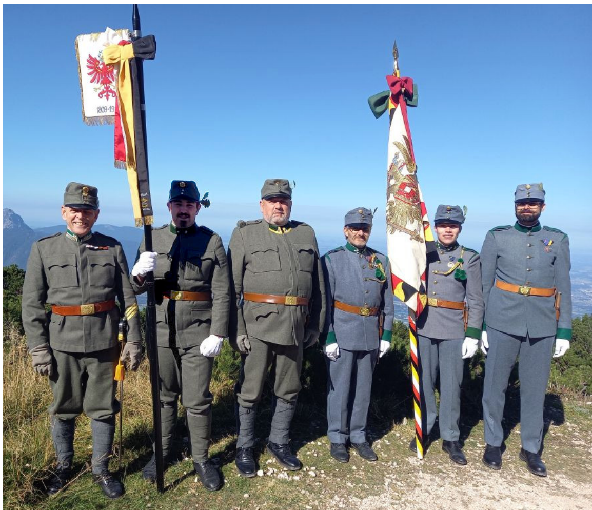
Im Alpinen darf unsere Feldstandarte nicht fehlen.