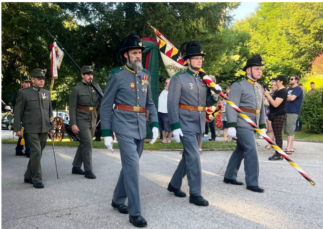
In Gmunden locken unsere Uniform auch einige Schaulustige an.

Mit Fahne und Standarte reisten sechs Schwazer Kaiserjäger nach Gmunden in Oberösterreich um am Regimentstag des IR 42 „Herzog von Cumberland“ am 07.07. auf dem Schloss Cumberland teilzunehmen.