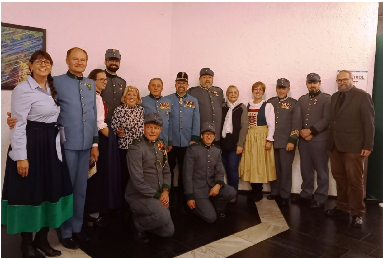
Einige Kameraden besuchten auch das Kaiserjägermusik Konzert am 08.12.