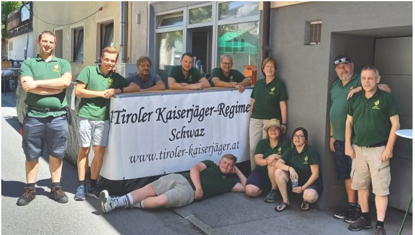
Unsere Dorffestmannschaft der 1. Schicht.