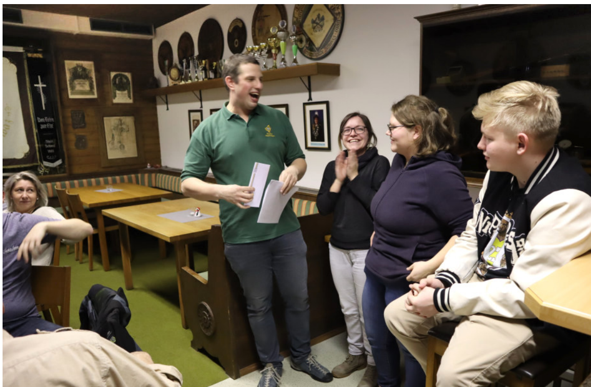
Unsere Mädels schlugen heuer manch einen unserer Kameraden.