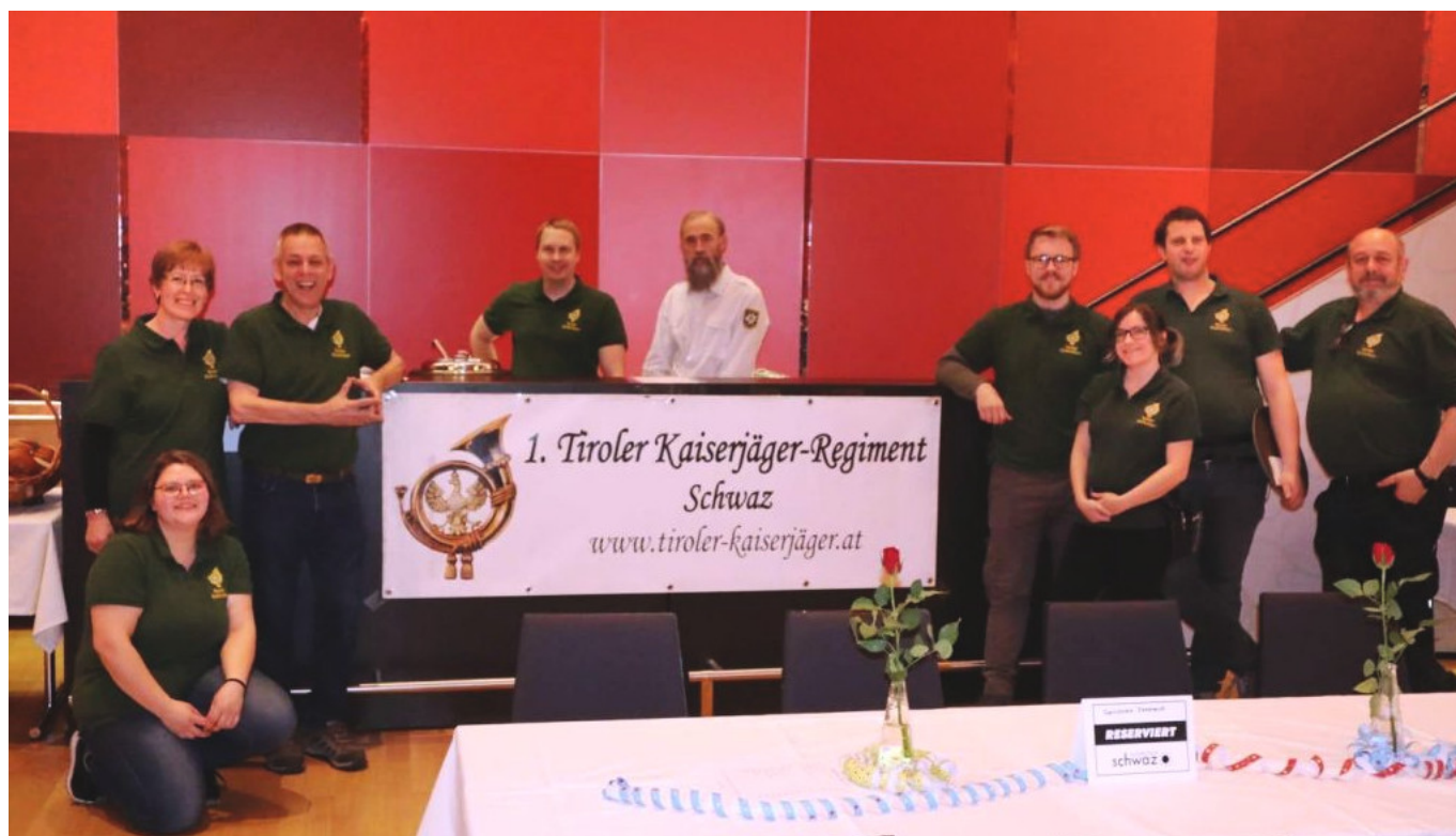
Unser Team beim Rosenmontagsball

Am 20.02. fand im Silbersaal des SZentrums der Rosenmontagsball des Seniorenreferates statt. Wir Kaiserjäger übernahmen dabei die Verpflegung der Gäste und konnten die großzügigen Spenden der Vereinskassa zukommen lassen.