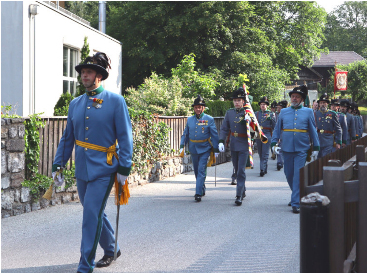
Aufmarsch über den Pirchanger

Die nächste Prozession in Schwaz fand am 18.06. statt. Auch hier waren wir wieder mit 16 Mann vertreten und schossen wie gewohnt eine Salve nach der Feldmesse. Anschließend übernahmen D'Alpler am Maximilian Platz die Verpflegung der Vereine.