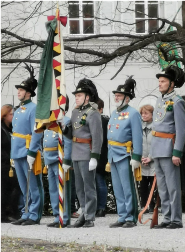
Ob sie wohl aus Ernst oder wegen der Kälte so streng dreinschauen?