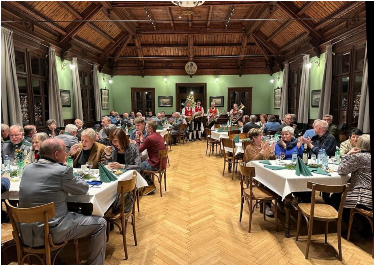
Unser Vorstand war auf die Weihnachtsfeier der Ortsgruppe Innsbruck eingeladen.