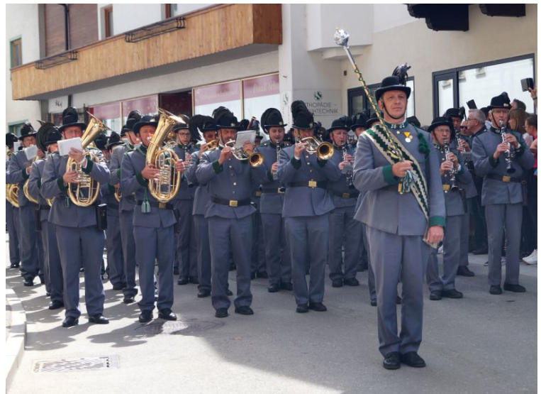
Beim Gauderfest rückten wir gemeinsam mit der Kaiserjägermusik aus.

Am 07.05. nahmen wir nach einigen Jahren Unterbrechung als Teil der Ehrenkompanie des Tiroler Kaiserjägerbundes am Festumzug des Gauder Festes Teil.