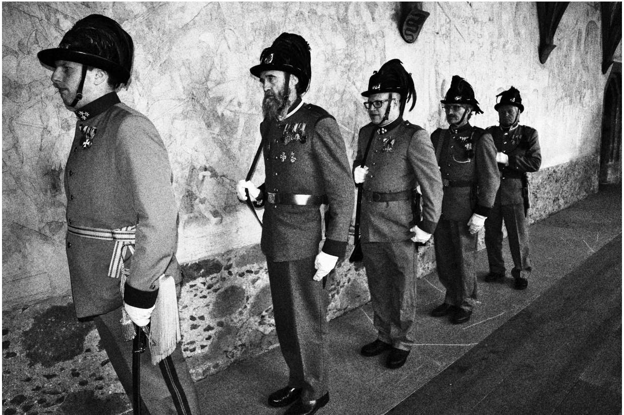
Vergatterung zur Wachablöse